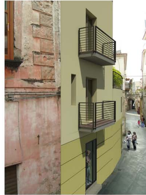
Ristrutturazione edilizia - S.p.a.c.e. s.r.l