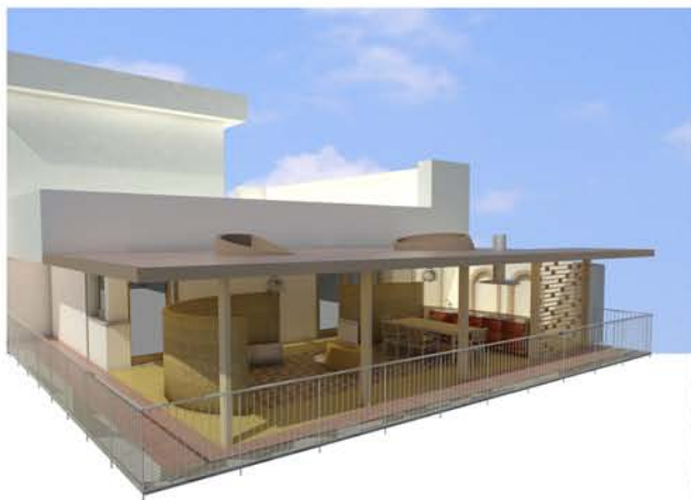
Ampliamento appartamento -S.p.a.c.e. s.r.l. (modellazione da autocad)