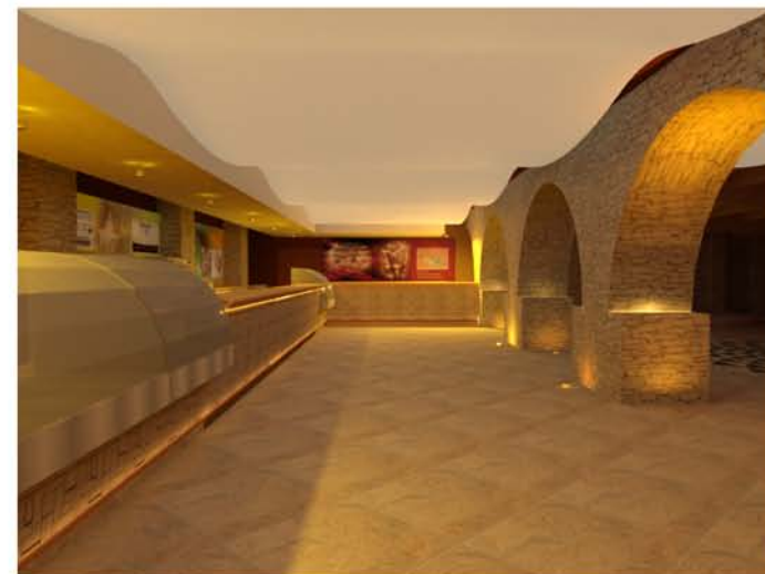
Bar nuova costruzione - S.p.a.c.e. s.r.l ( solo render da modellazione in sketch up)