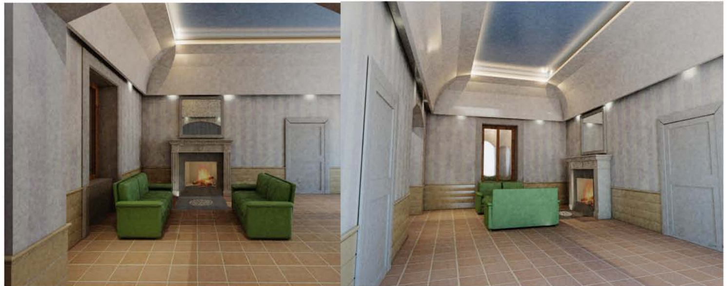
Ristrutturazione appartamento in edificio storico - S.p.a.c.e. s.r.l